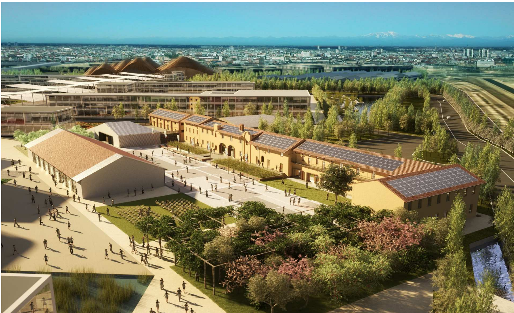
Rendering evocativo della Cascina Triulza